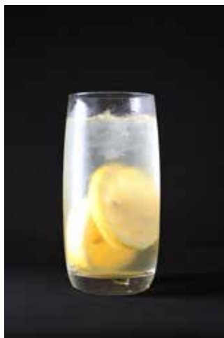
PORKER LEMON SQUASH