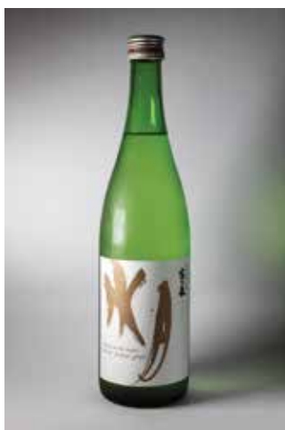
FUKUCHO MOON ON THE WATER JUNMAI GINJO