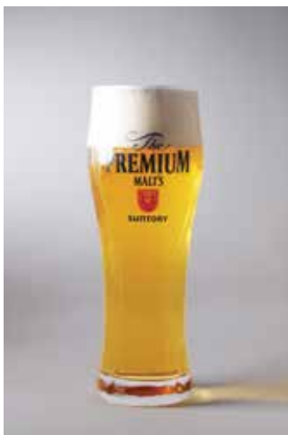
SUNTORY THE PREMIUM MALT'S DRAFT

T I V A T K C O C · L I V A B H G I H · R E E B