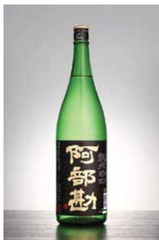
ABEKAN JUNMAI KARAKUCHI