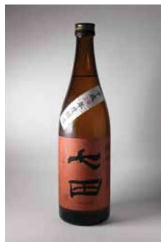
SHICHIDA MIGAKI 75% JUNMAI