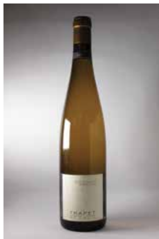
TRAPET ALSACE RIESLING BEBLENHEIM